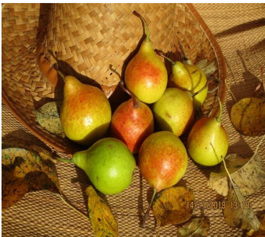
Rousselet 'd Hyver

Zo ontdekten we van de Rousselet d'Hyver, een kennelijk al in 1758, in Pomologia (J.H. Knoop) beschreven peertje, voornamelijk vanwege de bijzondere warme en droge zomer, eindelijk haar waarschijnlijk juiste rasnaam.