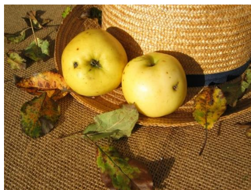
Afbeelding: Credes Quittenrenette

naam Credes Quittenrenette in twee oude assortimentslijsten daterende uit het midden van de 19e eeuw te vinden zijn. Dat zijn, ten eerste, een lijst een van een minder bekende kweker, omstreeks diezelfde tijd met zijn kwekerij residerende op De Schovenhorst, te Putten.