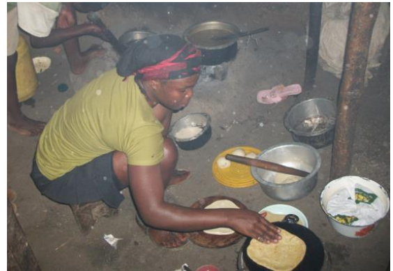
dit was de oude keuken

is en doet alles zelf wat zelf gedaan kan worden. Voor verder materiaal komt hij nog 7.000 euro tekort.